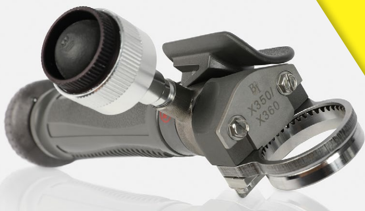
Quantum Flex®: Zwiększenie prędkości

Kiedy ludzie mówią, że nowe trymery Quantum Flex® firmy Bettcher zmieniają rzeczywistość w przetwórstwie mięsnym, to nie tylko słowa. Dowodzą tego testy praktyczne prowadzone w czasie rzeczywistym w zakładach przetwórczych!