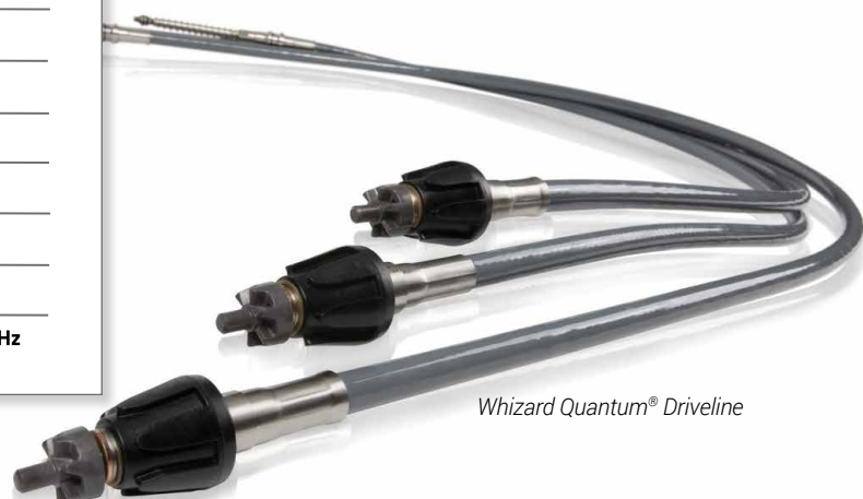
Whizard Quantum® Driveline