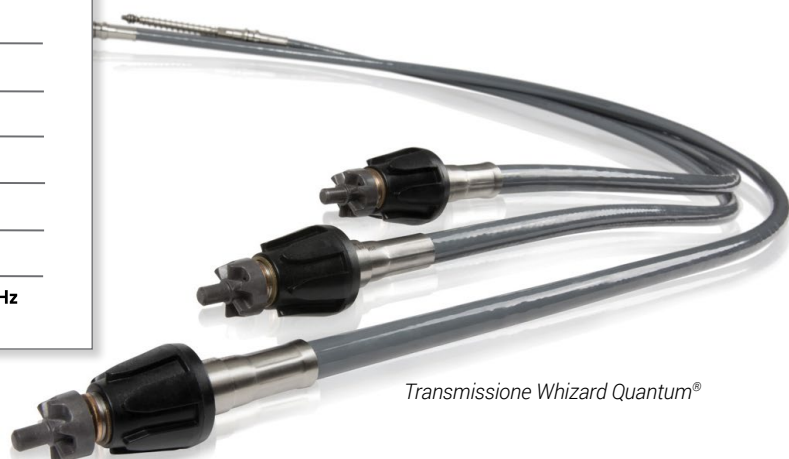
Transmission Whizard Quantum®